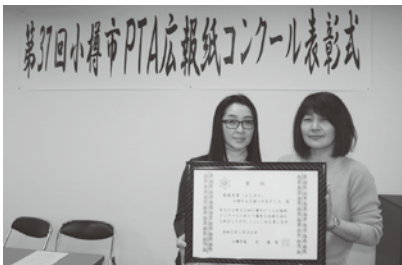
最優秀賞 (市長賞) 花園小学校PTA「はなぞの」